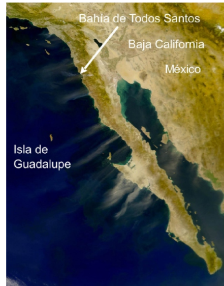
Figura 1. Polvo transportado al mar durante la "Condición Santa Ana" del 9 al 11 de febrero del 2002.

La característica importante en este caso es el "viento seco" proveniente del norte-noreste, y que transporta grandes cantidades de polvo hacia el océano adyacente. En ocasiones, la intensidad y la permanencia de este viento sobre el océano son suficientes para generar filamentos de surgencia o afloramiento de aguas profundas ricas en nutrientes hacia la superficie del océano (Trasviña et al., 2003). La conjunción de estas surgencias peculiares de otoño e invierno, con la fertilización de las aguas superficiales, con grandes cantidades de polvo, son también una característica de la "Condición Santa Ana"... no todo es viento seco, alergias e incendios forestales.